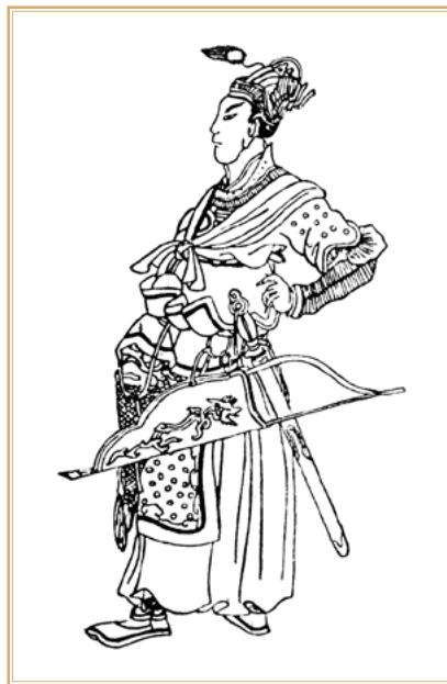
Бату-хан на средневековом китайском рисунке XIV в.

Остальные, менее масштабные цели монгольского нашествия можно лишь предполагать на основании анализа конкретных действий войска Бату в Среднем Подунавье, что является главным предметом исследования в настоящей работе.