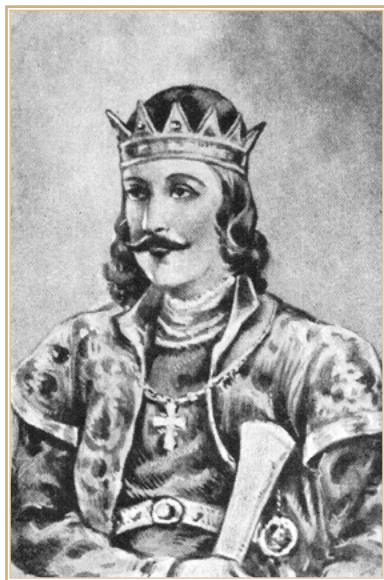
Андраш II. Изображение XIX в.

неуклонного движения монголов «к последнему морю». На самом же деле, как показано ниже, все было гораздо сложнее.