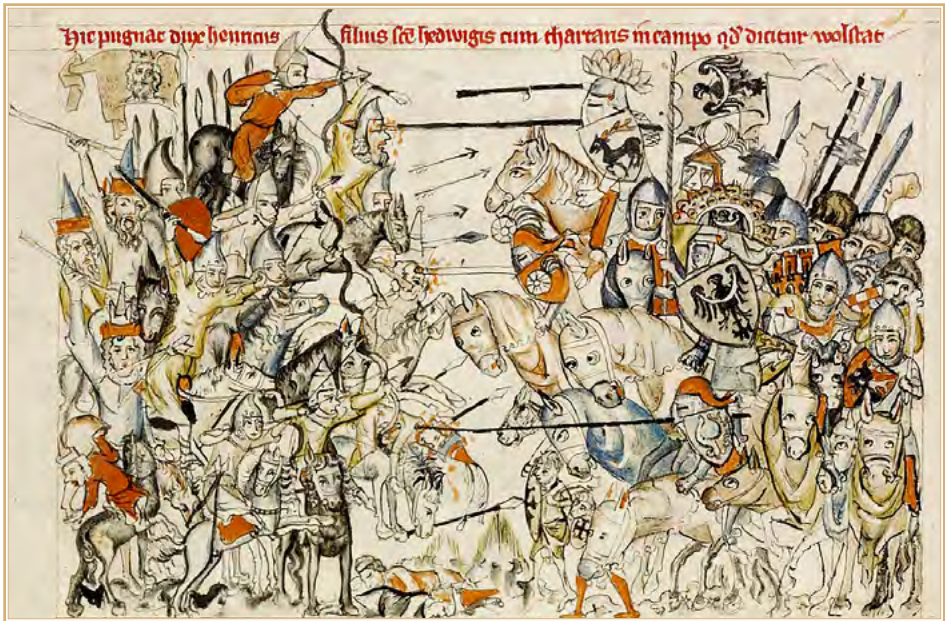
Битва при Легнице. Средневековая миниатюра.

довику IX и германскому королю Конраду IV, но конкретной помощи от них он так и не получил.