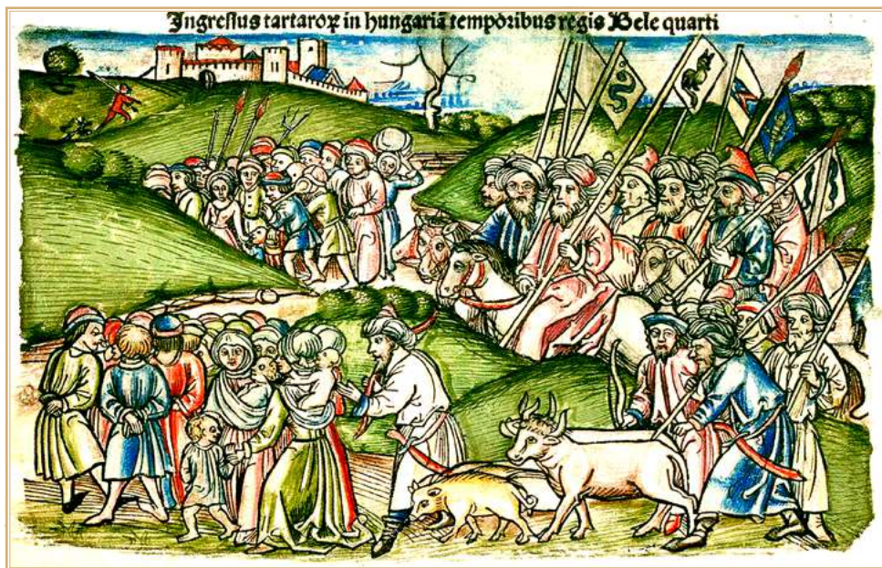
Сражение на Мухском поле. Венгерская иллюстрированная хроника Chronicon Nictum . 1358 г.

Генеральное сражение армий Бату и Бела IV произошло 11 апреля 1241 г. на Мухском поле, находившемся в середине пути от Верецкого перевала (через который Бату вступил на территорию Венгерского королевства) к Пешту. Войско Бела IV потерпело сокрушительное поражение, а сам он спасся бегством через северо-западные комитаты Венгрии (совр. Словакия) в Австрию. Уже 15 апреля передовые отряды монгольского войска достигли Пешта 21 . В течение последующих недель вся восточная половина Венгерского королевства оказалась под контролем монголов. Казалось бы, ничто не мешало Бату отдать приказ о форсировании Дуная для достижения своей главной цели — превращения Венгрии в одну из провинций Монгольской империи.