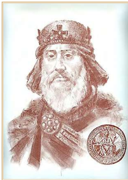
Бела IV. Изображение XIX в. Из открытых источников

ские ханы (Валахия, Молдавия, Половецкие земли и Галиция). Конкретный casus belli означало принятие Кетеня (половецкого князя Котяна. — М.Ю.) и его народа в 1239 г.» 8 . С этими утверждениями венгерского историка трудно согласиться, поскольку в 1234 г. бесславно закончилась длившаяся 29 лет борьба короля Венгрии Андраша II (1205–1235) за юго-западную Русь. Как свидетельствует магистр Рогерий в своей «Горестной песне», написанной вскоре после возвращения орд Бату из европейского похода в Поволжье, накануне вторжения монголов в венгерском обществе были распространены опасения вторжения из-за Карпат не степняков, а жителей Руси с намерениями отомстить за ущерб, нанесенный им венграми во время длившихся почти три десятилетия разорений войском Андраша II Галицкой и Волынской земель 9 . Единственным аргументом в пользу точки зрения Я.Ж. Пинтера является принятие Белой IV титула «короля Кумании» 10 , но это отражало скорее верховную власть венгерского короля над областью поселения половцев в Венгрии, чем претензии на распространение власти венгерской короны на Половецкую степь.