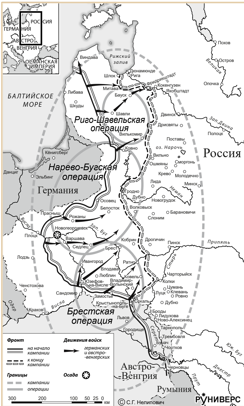
Общее наступление армий Центральных держав на русском фронте (июль–август 1915 г.)