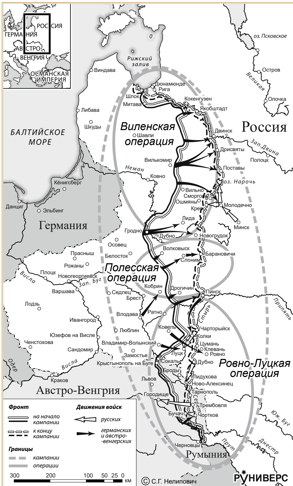
Осенняя кампания 1915 г. на русском фронте (сентябрь–ноябрь)