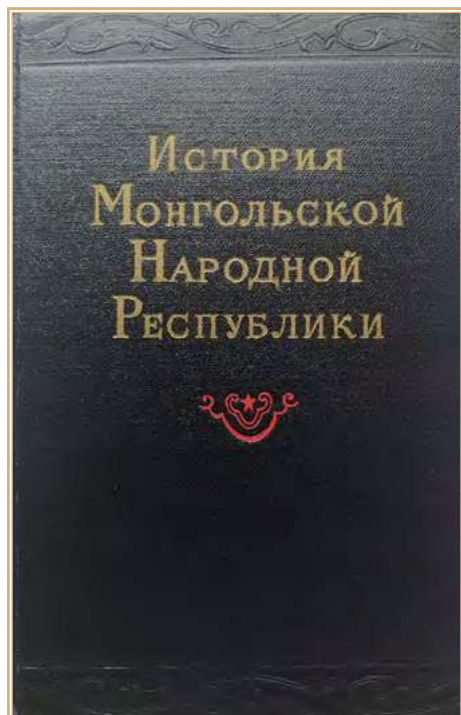
Обложка первого издания коллективной монографии «История Монгольской Народной Республики» (1954).