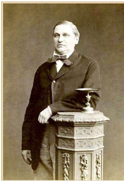
Василий Васильевич Григорьев.

зин (1818–1896), В.П. Васильев (1818–1900), В.Г. Тизенгаузен (1825–1902), К.П. Патканов (1833–1889) и ряд других. Их усилиями профессиональные монголоведы получили в свое распоряжение широкий круг источников, переведенных с китайского, арабского, персидского, армянского и других языков и проливающих свет на историю монголоязычных народов, а также богатые разработки методологического характера. В России были изданы «Родословное древо тюрков» хивинского хана Абу-л Гази (1603–1664, годы правления 1645–1663), первые главы «Юань ши» в переводе Н.Я. Бичурина, «Драгоценное сказание» ордосского князя Саган-Сэцэна (1604 — после 1662) в монгольском оригинале и немецком переводе Я. Шмидта (1779–1847), анонимное «Золотое сказание» на монгольском языке и в переводе на русский ученого бурятского ламы Галсана Гомбоева (1822–1863), частично — «Сборник летописей» Рашид ад-Дина (1247–1318) в переводе И.Н. Березина и другие восточные, а также западные источники и русские летописи. Большим подспорьем оказались золотоордынские ярлыки, выдававшиеся русским митрополитам и привлекавшие пристальное внимание отечественных ученых. Сказались также тесные контакты с монголоязычными народами, проживавшими как в Российской империи, так и в самой Монголии. Это быстро выдвинуло российское монголоведение на передовые рубежи.