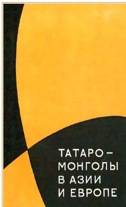
Обложка первого издания коллективной монографии «Татаро-монголы в Азии и Европе» (1970). Из открытых источников

литературе, а во второй сделана интересная попытка разобраться в интригах вокруг ханского двора, повлиявших на идейное содержание «Сокровенного сказания монголов» 107 . В целом же публикация этого сборника была большим шагом вперед, и не случайно через семь лет он был переиздан с некоторыми дополнениями и исправлениями 108 .