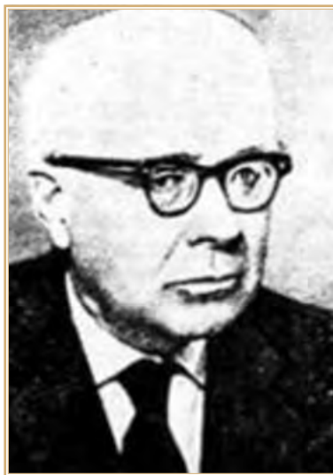
Илья Павлович Петрушевский.

тан, а лучше сказать, просто игнорировался, хотя, как отмечалось выше, определенные прорывы в этой области наблюдались еще в первой половине XIX в. В лучшем случае историки повторяли тезис о вере Чингисхана и его людей в покровительство Неба (или бога) 72 , но приоритет всегда оставался за сугубо земными, социально-экономическими процессами, приведшими в движение огромные массы кочевников. Однако было бы несправедливым обвинять советских ученых в замалчивании монгольской имперской идеологии. Во-первых, они углублялись в другие вопросы истории Монголии, где достигли хороших результатов, во-вторых, ментальный мир кочевников вообще был еще мало изучен мировой наукой 73 . Даже классики отечественного востоковедения не смогли до конца (насколько им позволяли доступные тогда источники) проникнуть в тайны принятия решений Чингисханом и представителями его «золотого рода». Например, сравнивая кругозор Тамерлана (1336–1405) и Чингиса, В.В. Бартольд оценивает когнитивные способности последнего довольно скептически: «Мировоззрение Чингисхана до конца было мировоззрением атамана разбойников» 74 . Позже Б.Я. Владимирцов