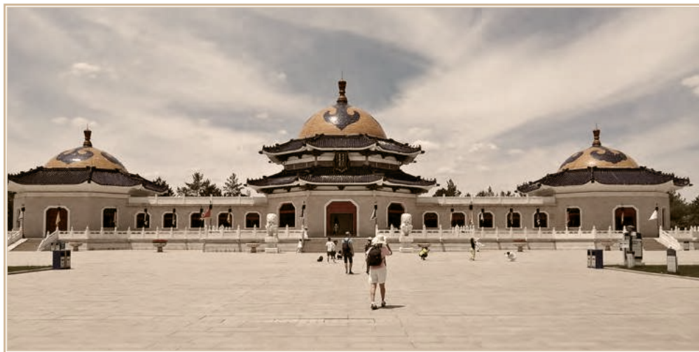
Музейно-мемориальный комплекс Чингисхана Эджен-Хоро (Внутренняя Монголия, КНР). Июнь 2025 г.

монголами двигал не религиозный фанатизм, а «жажда добычи, власти и крови» 30 . Монголов автор изобразил абсолютными дикарями, ненавидевшими оседлый образ жизни и образование, отчего «они явились современному миру не столько завоевателями, сколько истребителями рода человеческого» 31 . Почти 30 лет спустя вышло второе, значительно расширенное и переработанное издание книги М.И. Иванина 32 . Оно также лишено оригинальности, но в то же время достаточно основательное и для своего времени довольно неплохое. Правда, автор продолжил утверждать, что Чингисхан замышлял покорение мира 33 и однажды голословно обмолвился о его желании, чтобы потомки продолжили начатое им дело 34 .