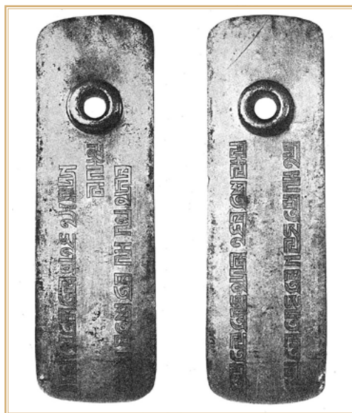
Минусинская пайцца.

мнение Аввакума, но, зная, что квадратное письмо изобрел по приказу Хубилая (1260–1294) Пагба-лама (1235–1280) лишь к 1269 г., когда Мункэ уже не было в живых, предположил, что письмо на пайцзе — тангутское, придуманное первым тангутским императором Юань-Хао (1038–1048) и потом заимствованное монголами 10 . Живший в России немецкий монголовед и тибетолог Я. Шмидт резонно возразил, что надпись сделана квадратным письмом и данное слово следует относить не к хагану, а к Небу 11 . Разумеется, на защиту Аввакума встал В.В. Григорьев, к нему присоединился и Н.Я. Бичурин, находивший критику Я. Шмидта нападениями на русскую науку; тот резко отвечал 12 . Н.Я. Бичурин считал аналогом спорного монгольского оборота обычную фразу китайских импе-