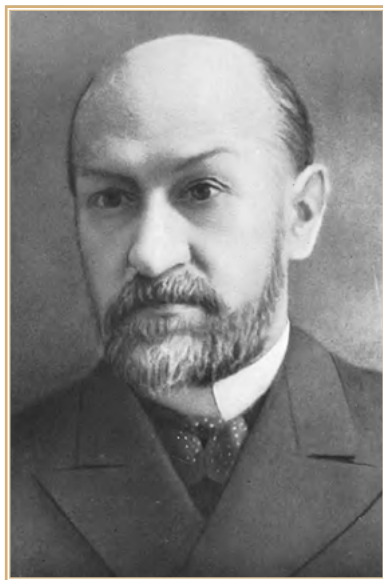
Василий Владимирович Бартольд.

и разделял мнение И.Н. Березина, который, допуская значительное влияние на кочевников китайской культуры, полагал, что Чингисхан обладал «здравым смыслом дикаря, полного энергии», и постановлениями своей Ясы положил заслон ее распространению в созданном им государстве 41 . Главную роль в движении номадов В.В. Бартольд оставлял за экономическими причинами 42 . Ученый считал, что Чингисхан был сначала всего лишь «предводителем шайки искателей приключений» 43 . В специально посвященной ему статье в «Энциклопедии ислама» он писал: «Невозможно доказать, что Чингиз-хан лелеял великие планы завоеваний во время своей ранней карьеры в Монголии. Его первые кампании против соседних оседлых стран были нацелены лишь на грабеж; только значительно позже монгольская власть установилась прочно в этих странах. Походы на запад были предприняты первоначально для преследования врагов, которые там укрывались; лишь в ходе событий эти походы постепенно развились в преднамеренные завоевания» 44 .