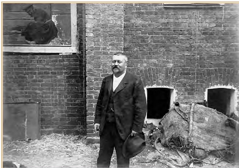
Савва Тимофеевич Морозов на строительстве здания Московского Художественного театра. Фото 1901 г.

Записки скучного человека: https://humus.livejournal.com/5335851.html