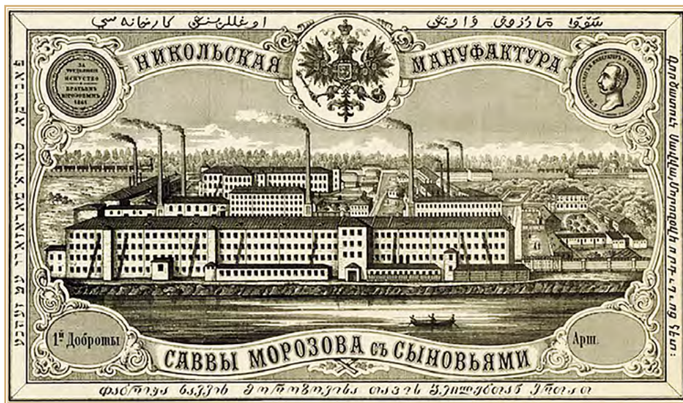
Ярлык на товарах Товарищества Никольской мануфактуры Саввы Морозова с сыновьями. 1870 г.