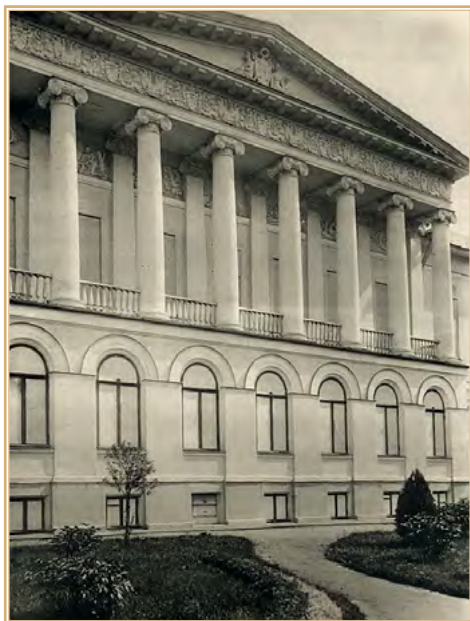
Городская усадьба Найденовых «Высокие горы» на Земляном Валу в Москве.