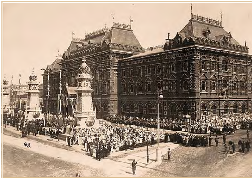
Горожане на Воскресенской площади приветствуют императора Николая II и императрицу Александру Федоровну (в экипаже), прибывших в Городскую думу. 23 мая 1896 г.

Записки скучного человека: https://humus.livejournal.com/3862881.html