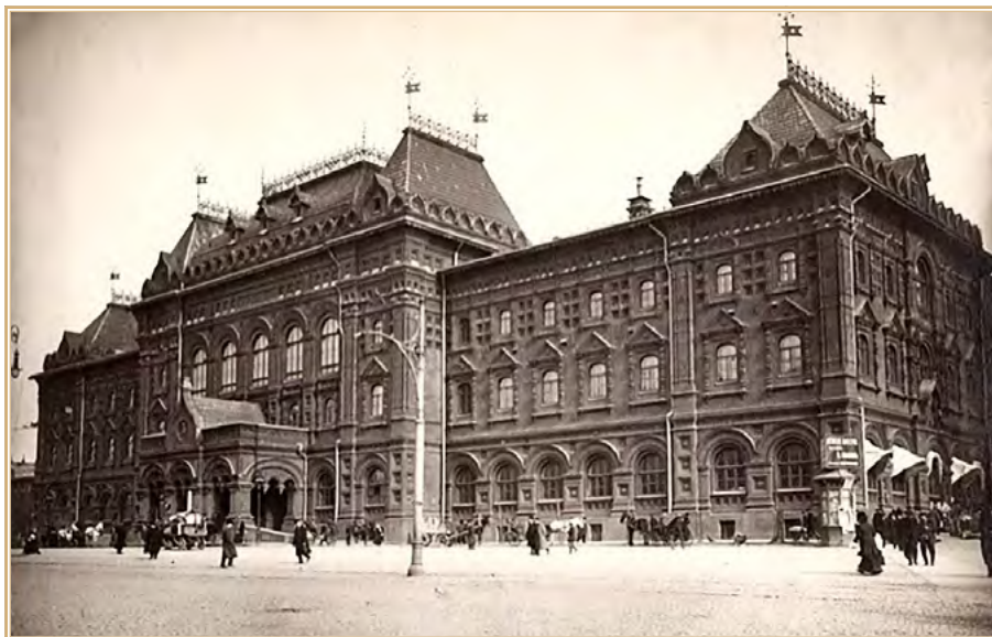
Здание Московской городской думы. Фото 1912 г.