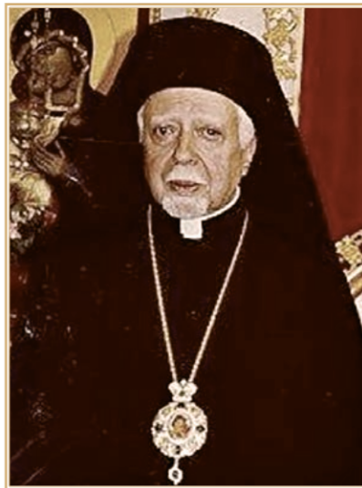
Гавриил Салиби

Что касается православного патриарха Илии IV Муаввада (1914–1979), главы Антиохийского патриархата с сентября 1970 г., то он сохранял добрые отношения с Русской православной церковью, бывал в Советском Союзе в январе 1972 г. и октябре 1974 г., а за свою горячую поддержку на международном уровне палестинского дела в середине 70-х гг. заслужил прозвание «патриарха арабов» 9 . Американский резидент в Бейруте передавал в июне 1977 г. интересный факт: «Источник, осведомленный об этом периоде [событиях с середины до конца 60-х гг.], сообщил сотруднику посольства, что Илия, который тогда был епископом Алеппо, был одним из прозападных епископов, сыгравших ведущую роль в противодействии этой группе при поддержке своего друга Хафеза Асада, в то время министра иностранных дел. В результате подавляющее число церковных епископов сегодня стали провосточными. Патриарх Илия сочувствует как пансирийским, так и арабским национальным устремлениям и критически относится к ливанским христианам, выступающим за отделение. Он поддерживает регулярные контакты с сирийско-националистической партией» 10 .