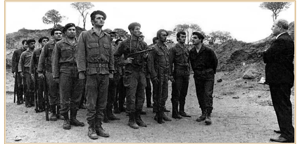
Бойцы Катаиб

он был в числе трех соавторов (другие двое — марониты Фуад Афрам ал-Бустани и о. Булос ан-Нааман) программы действия партии по итогам конференции, состоявшейся в январе 1977 г. в местечке Сеййидат ал-Бир. Показательно, что основные идеи этой программы (или декларации) в неизменности сохранились у маронитов до наших дней и нашли свое отражение в проекте реформ, изложенном в книге Хикмата Амаля Абу Зейда 2021 г., переведенной и изданной в России 14 . Основными пунктами той программы 1977 г. были сохранение суверенитета и защита независимости Ливана, но, главное, проводилась идея, что государству требуется коренная реформа, причем любая будущая политическая формула Ливана должна предполагать плюралистический характер страны — либо через децентрализацию, либо федерализацию. Особо подчеркивалось, что социально-политические права христиан в ходе будущей политической реформы не должны быть меньше, чем права нехристиан. В условиях Ливана этого предполагалось достичь, предоставив каждой «конфессиональной группе» автономию в управлении своей культурой, образованием, финансами и социальными вопросами 15 .