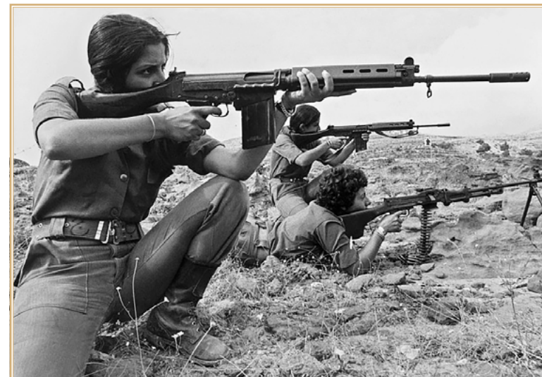
Женщины-бойцы ливанской христианской милиции

А в августе он выражал тревогу относительно возможности выхода сирийцев из Ливана, поскольку могла начаться, по его мнению, «резня христиан христианами»: сторонники Франжье жаждали мести, и их атакам после ухода сирийцев могла подвергнуться якобы не только родина Жмайелей Бикфайя, но и Ашрафия (Восточный Бейрут), где боевики Катаиб и Нумур наводили страх на население и грабили дома. Он оценивал падение поддержки этого альянса среди населения с 20% осенью 1977 г. до 5% к августу 1978 г. 34