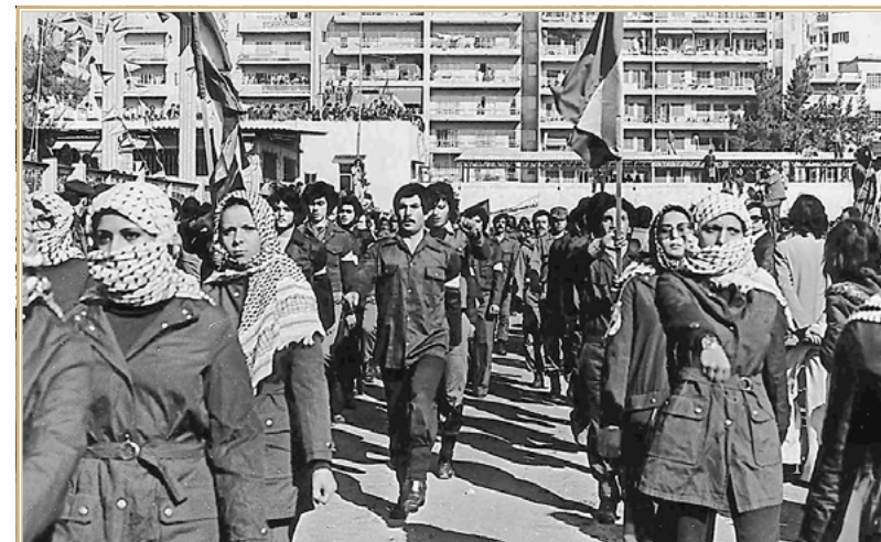
Палестинские боевики в Ливане

Такой модели — иногда вкупе с заявкой на особое, «финикийское» происхождение — придерживались так называемые ливанские правые. То были националисты, далекие от арабизма. Их традиционализм проистекал из охранительной идеи историчности и плодотворности своего рода пирамидальной системы социальных связей. Глава локального клана, обладавший безграничным авторитетом и полномочиями лидера ( ка'ид , с отчетливой конфессиональной, как правило, униатской окраской), осуществлял ощутимую социальную поддержку, но только внутри