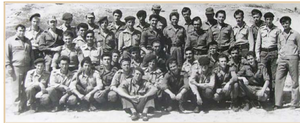
Советские офицеры 231-го зрп вместе с сирийскими коллегами — групповое фото

верным ограничивать российско-сирийские связи исключительно традиционными сферами сотрудничества. Начиная с 1992 г. российско-сирийское торгово-экономическое и техническое сотрудничество сталкивалось с проблемами в результате нерешенности вопросов, связанных с погашением советских кредитов и прекращением государственной поддержки российского экспорта в Сирию. Несмотря на это Россия сохраняла свою значимость для САР в качестве потенциально важного экономического партнера. При содействии российских организаций в Сирии осуществлялось строительство гидроузла «Тишрин» на реке Евфрат, продолжалось проектирование, ирригационное строительство и освоение земель на массиве Мескене и в районе Халеба, оказывалось содействие в нефтедобыче и по ряду других объектов. Созданные и эксплуатируемые при российском участии объекты играли важную роль в экономике Сирии. В середине 1990-х гг. они обеспечивали выработку 1/3 электроэнергии в стране, добычу около 30% нефти, орошение свыше 50 тыс. га засушливых земель на массиве Западное Мескене и в прибрежном районе. В конце 1997 г. началось российско-сирийское сотрудничество в области атомной энергетики. Сирийская сторона проявила заинтересованность в проведении соответствующих переговоров для определения возможных направлений взаимодействия и подписания соответствующего меморандума. В опубликованном заявлении российского правительства говорилось о необходимости развития отношений в данной области 9 .