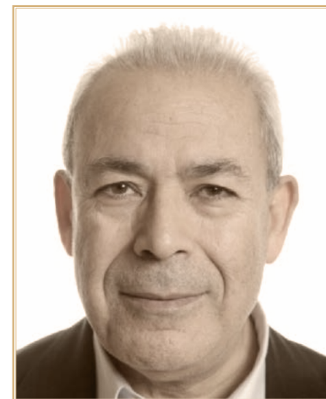
Бурхан Гальюн

ния 23 . К тому же сирийская оппозиция не была признана ведущими членами международного сообщества, прежде всего арабскими странами Ближнего Востока. Поэтому любое изменение российского статус-кво в Сирии автоматически вело если не к утрате, то к размыванию наших позиций в Леванте. Допустив смену парадигмы власти в САР, Россия уже никогда не могла бы иметь того, что имела. Во второй половине апреля 2012 г. в Москву прибыли представители оппозиции из Национальных координационных комитетов (НКК). На переговорах в Москве «Комитеты» поддержали мирный план К. Аннана и выразили желание установить конструктивные отношения с Россией. В то же время ряд руководителей «Комитетов» выступали за смену законной сирийской власти и коренное реформирование сирийских органов безопасности. В отличие от СНК «Комитеты» были против какого-либо внешнего вмешательства в сирийские дела и милитаризации сирийского кризиса, возражали против монополизации какой-либо одной структурой права представлять интересы сирийской революции 24 .