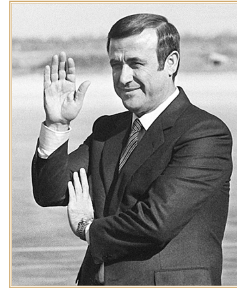
Рифа'ат Али аль-Асад

После распада СССР Россия продолжила отношения с Сирией. Однако их характер заметно изменился и не в лучшую сторону. Прежние многосторонние и многоуровневые связи отошли в сторону. Российско-сирийские отношения как бы «скукожились», ограничившись в основном поставками российского оружия и запчастей к нему. Прежнее место России в Сирии старались заместить Иран и Турция.