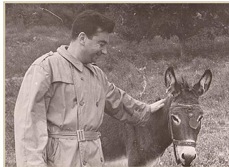
Е.М. Примаков. Эпизод командировки на Ближний Восток

Корреспондент RT Arabic: Как отреагировала международная пресса на Вашу миссию?