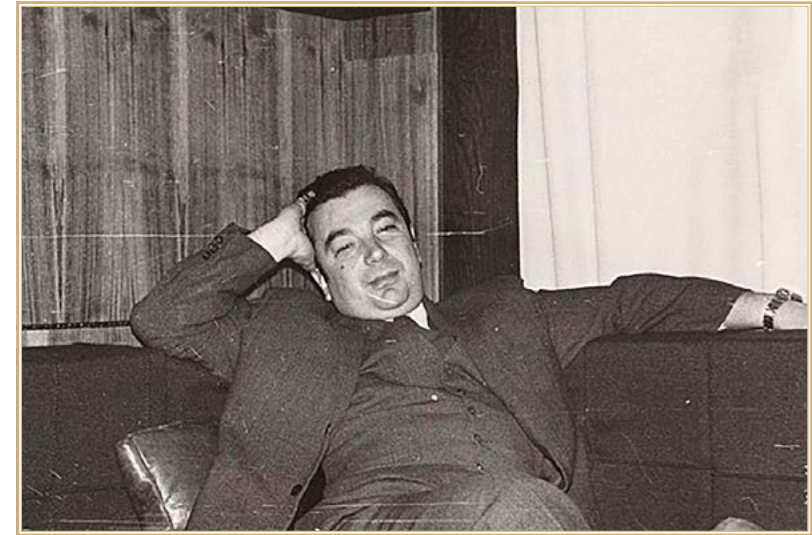
Е.М. Примаков. Короткий отдых в рабочем кабинете

дорвал солидарность арабского мира. Затем я поехал к Хосни Мубарак. Он также принял меня с большим доверием 14 .