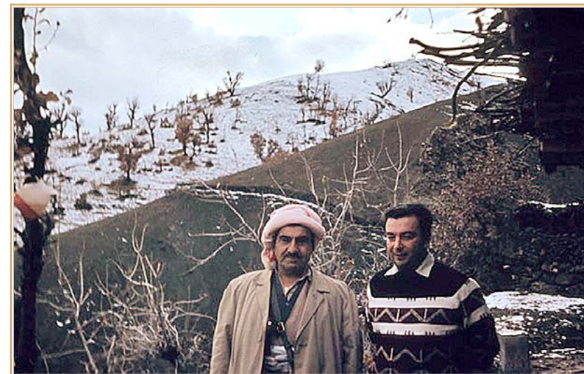
Е.М. Примаков (справа) в командировке на Ближнем Востоке

Корреспондент RT Arabic: Чувствовали ли Вы тогда, что это последняя крупная внешнеполитическая операция СССР?