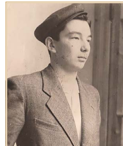
Е.М. Примаков — старшеклассник

Е.М. Примаков: Важно различать два момента: одно дело — «никто не мог предположить», другое — «Саддам Хусейн не предупредил». Это не одно и то же. Предположить возможность таких действий, в принципе, было можно.